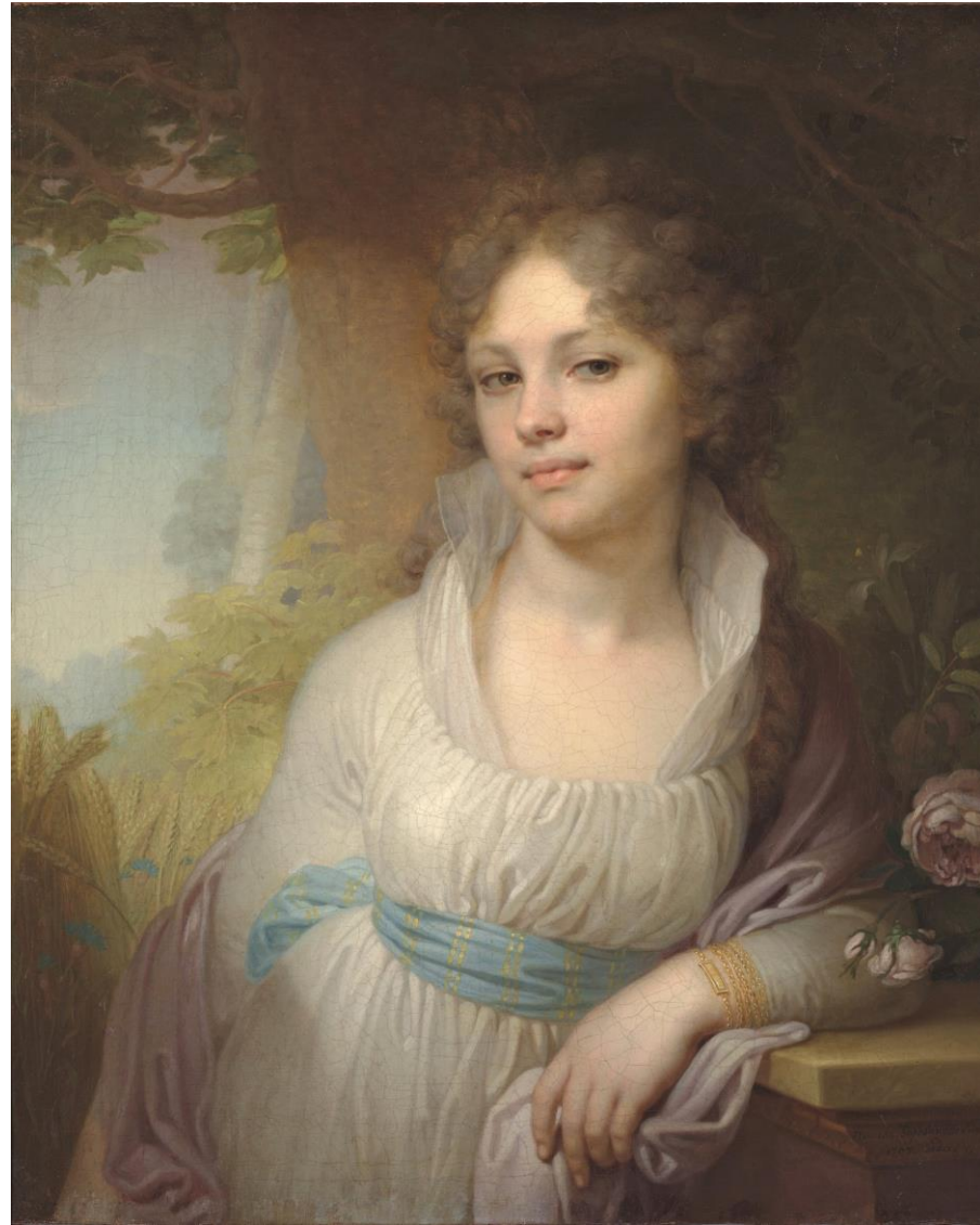
Портрет М.И.Лопухиной, Боровиковский Владимир Лукич, 1797

Элегическая мечтательность, томная нежность пронизывают всю художественную ткань произведения. Неясные, размытые контуры, сложные градации холодноватого колорита, переливающегося голубыми, сиреневыми, зеленоватыми, серебристыми оттенками, объединяют фигуру и пейзаж в единый гармоничный, музыкальный образ. Современный образ создала Соболева Амелия.