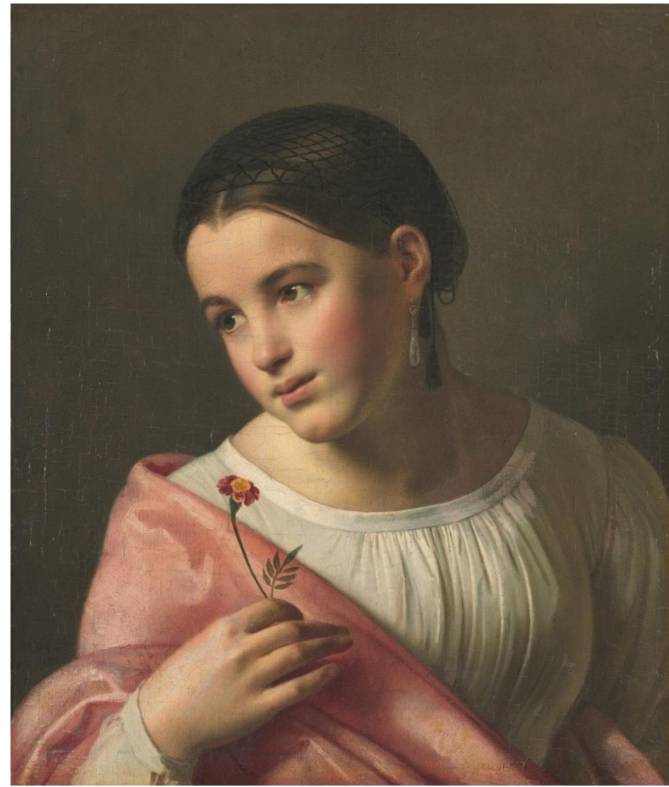
Бедная Лиза, Орест Адамович Кипренский, 1827

Картина написана на сюжет повести Н.М.Карамзина "Бедная Лиза" (1792), с восторгом встреченной публикой.